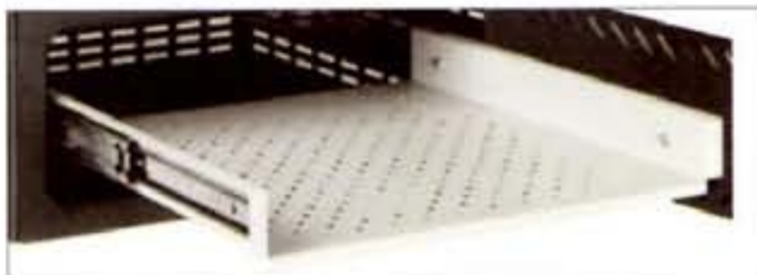
BANDEJA EXTENSIBLE SLIDING TRAY PLATEAU EXTENSIBLE